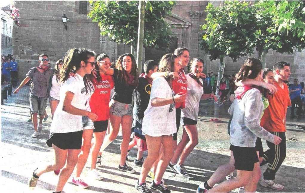
Los grupos de jóvenes dan vueltas y vueltas en torno a los árboles de la plaza San Martín.