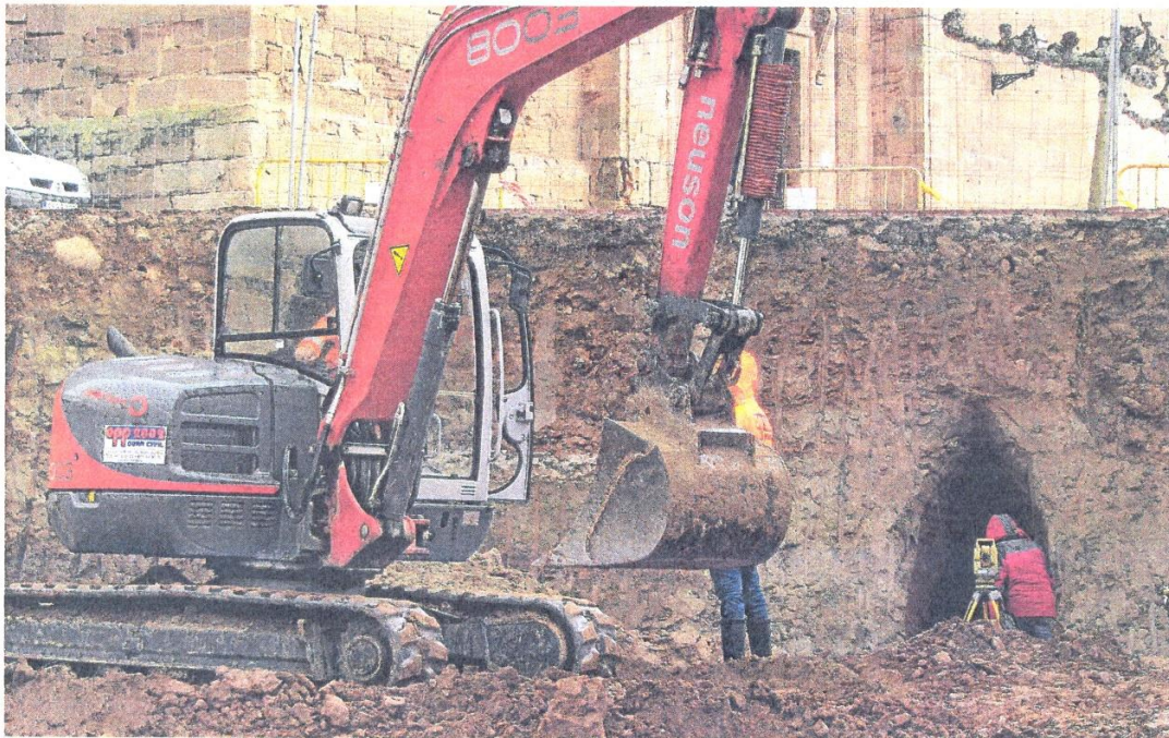
Segunda cueva aparecida en el subsuelo de la plaza de San Martín de Entrena en el marco de los trabajos de ampliación de la misma.

tórico y, por lo tanto, requieren de cierta protección.